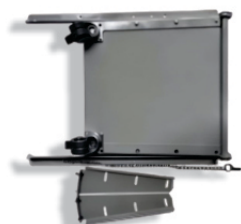
CARRO LATERAL Ref. 52300