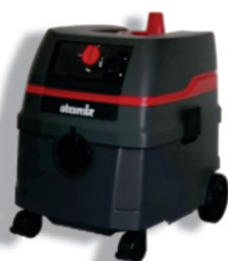
ASPIRADOR VIBRATO 1600/25 Ref. 2303014